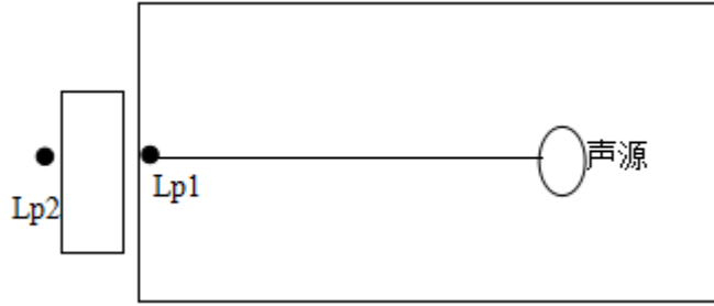
图 7-1 室内声源等效为室外声源图例