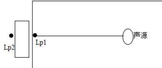
图 7-3 室内声源等效为室外声源图例